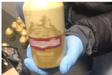
Funkcjonariusz trzyma w dłoni puszkę.