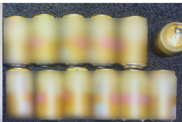
Puszki wyjęte z torby leżą na podłodze.