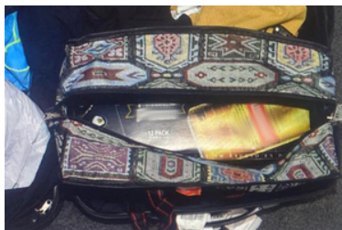
Torba podróżna, w środku karton.