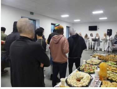
Koncert chóru gospel.

Chór gospel. Na pierwszym planie świąteczny poczęstunek oraz cudzoziemcy oglądający koncert.