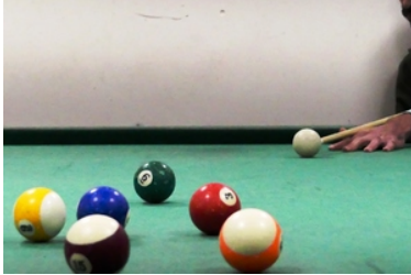
Na pierwszym planie stoją na stole kule bilardowe, na drugim planie widoczna dłoń i kij bilardowy.