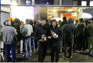
Mężczyźni stoją przed food truckiem.