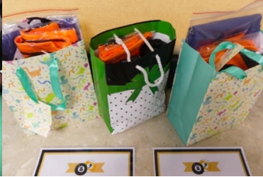
Torby z nagrodami dla zwycięzców.