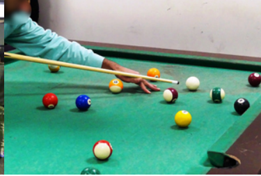
Mężczyzna uderza kulę kijem bilardowym.