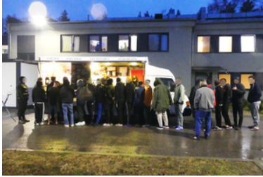
Cudzoziemcy stoją w kolejce po poczęstunek.