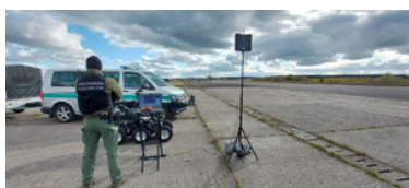
Funkcjonariusz stoi na płycie lotniska, przed nim stoi robot i samochód z przyczepą.