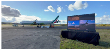
Od lewej strony na płycie lotniska stoi ciągnik, samolot. Po prawej stronie na podwyższeniu stoi duży ekran.