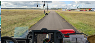
Widok z wnętrza pojazdu na płycie lotniska.