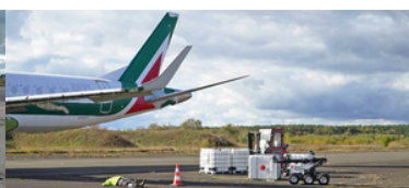
Na płycie lotniska leży uszkodzony, do pojemników podjeżdża robot. Po lewej stronie widoczny tył samolotu.