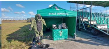
Przed namiotem stoi sprzęt wykorzystywany przez pirotechników Straży Granicznej.