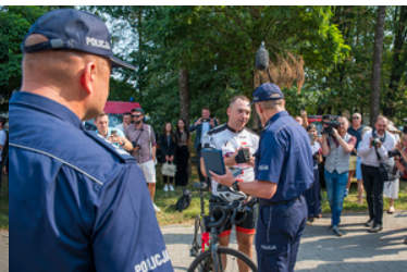
Kolarz odbiera gratulacje.