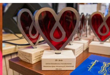
Pamiątkowa statuetka z okazji 20-lecia Centrum Krwiodawca i Krwiolecznictwa.