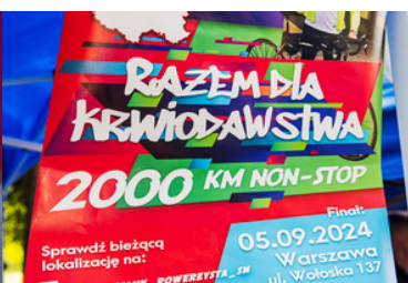
Plakat promujący rajd.