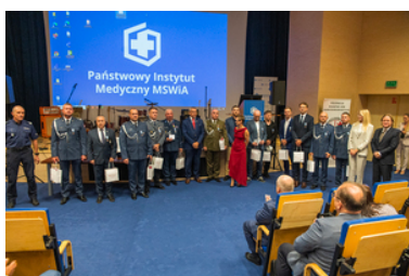
Zdjęcie grupowe wyróżnionych, gości i kierownictwa centrum.