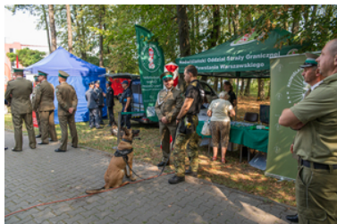
Namiot promocyjny Nadwiślańskiego Oddziału Straży Granicznej. Widoczni są funkcjonariusze SG.

kilometrów w sześć dni, a finał jego samotnego rajdu nastąpił podczas wczorajszego pikniku na terenie instytutu.