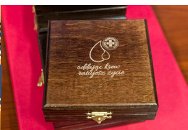
Pudełko z napisem oddając krew ratujesz życie.