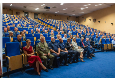
Zaproszeni goście siedzą w auli.