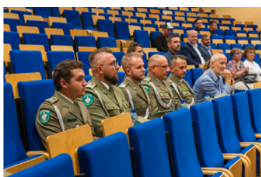
Delegacja Straży Granicznej siedzi na fotelach.