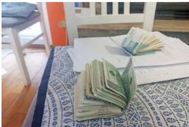
Na krześle leżą pliki pieniędzy.