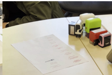
Na biurku leżą pieczętki oraz kartka papieru z odbitkami stempli.