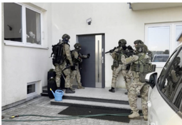
Funkcjonariusze Wydziału Zabezpieczenia Działań stoją z bronią przed drzwiami domu.

Śledztwo w sprawie nadzoruje Prokuratura Rejonowa w Grójcu.