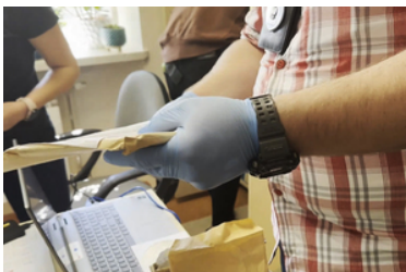
Funkcjonariusze przeszukują pomieszczenie. Widoczne są dokumenty trzymane w dłoniach, komputer.