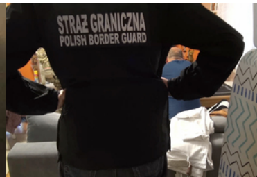
W kurtce z napisem Straż Graniczna stoi funkcjonariusz SG. W tle siedzi zatrzymany.