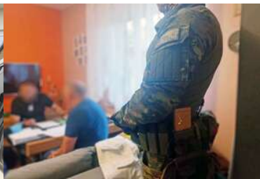
Po prawej stoi funkcjonariusz SG. W tle przy stoliku siedzi zatrzymany i funkcjonariusz prowadzący czynności.