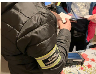
Funkcjonariusze sprawdzają dokumenty.