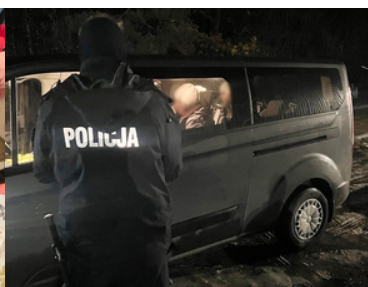
Policjant stoi przy samochodzie. W środku siedzą cudzoziemcy.