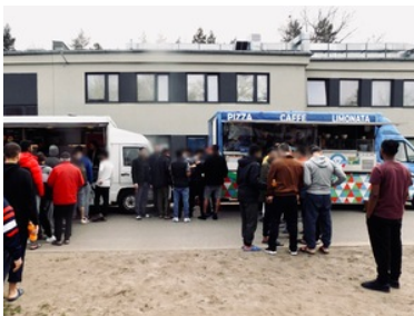
Wiosenny event na terenie lesznowskiego ośrodka

Powyższe przedsięwzięcie było dla cudzoziemców miłym urozmaiceniem czasu spędzonego w detencji oraz doskonałą okazją do wzajemnej integracji. Wspólne świętowanie z osobami umieszczonymi, daje możliwość zapoznania się z kulturą, a także zwyczajami osób z różnych krajów pochodzenia, co przekłada się na pozytywne relacje i nastroje.