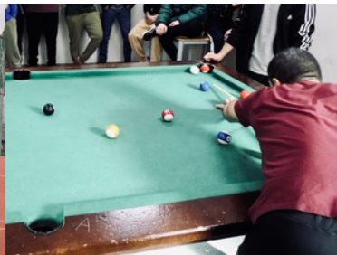
Wiosenny event na terenie lesznowskiego ośrodka