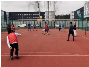
Wiosenny event na terenie lesznowskiego ośrodka