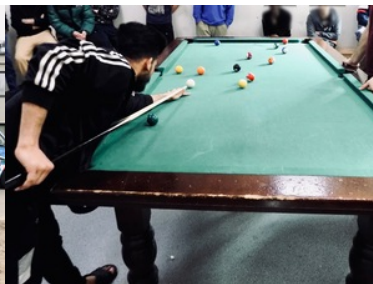
Wiosenny event na terenie lesznowskiego ośrodka