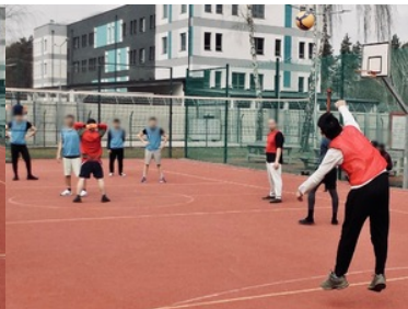
Wiosenny event na terenie lesznowskiego ośrodka