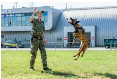
Funkcjonariusz - przewodnik psa służbowego i jego podopieczny.