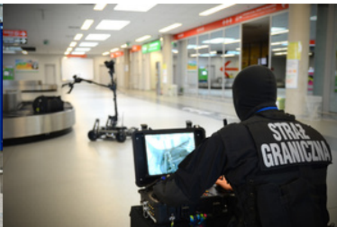
Funkcjonariusz steruje robotem pirotechnicznym.