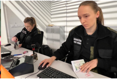
Funkcjonariuszki SG prowadzą kontrolę graniczną.