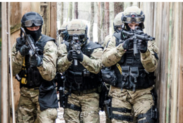
Funkcjonariusze Wydziału Zabezpieczenia Działań podczas ćwiczeń.