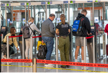
Funkcjonariuszka pomaga pasażerom podczas automatycznej kontroli granicznej.