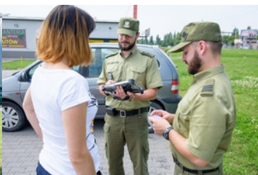
Funkcjonariusze SG przeprowadzają kontrolę legalności pobytu.