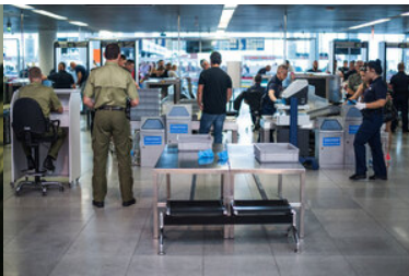
funkcjonariusz prowadzi nadzór nad kontrolą bezpieczeństwa.