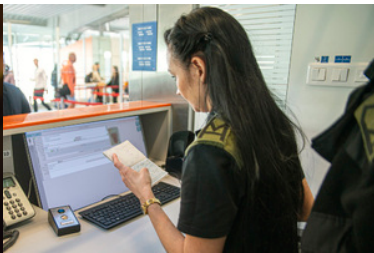
Funkcjonariuszka SG sprawdza paszport.