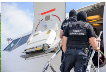
Interwencja funkcjonariuszy ZIS na pokładzie samolotu.