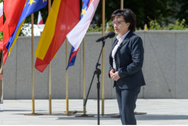
Przemawia Marszałek Sejmu Pani Elżbieta Witek.