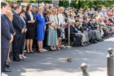
Na uroczystość przybyła wiewiórka.