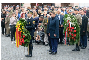
Kwiaty składa Pan Rafał Trzaskowski.