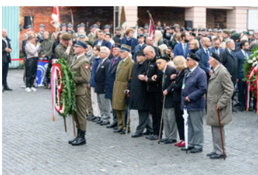
Delegacja Powstańców składa wieniec.