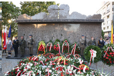
Przed Pomnikiem ofiar Rzezi Woli leżą wiązanki kwiatów i wieńce. Na bokach stoją posterunki honorowe.