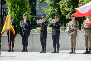
Na trąbkach grają sygnaliści Straży Miejskiej.