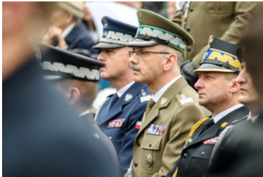
Komendant Główny Straży Granicznej gen. dyw. SG Tomasz Praga.