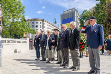
Hołd oddają Powstańcy warszawscy.