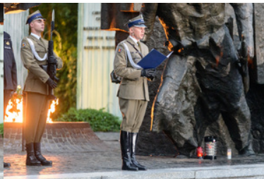
Oficer Pułku Reprezentacyjnego Wojska Polskiego czyta apel poległych.