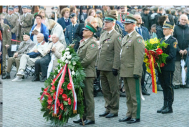
Delegacja NwOSG stoi z wieniec.