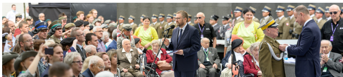
Prezydent RP odznacza