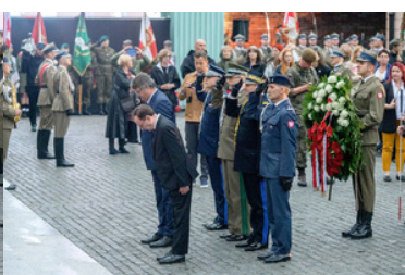
Honory oddaje delegacja MSWiA.