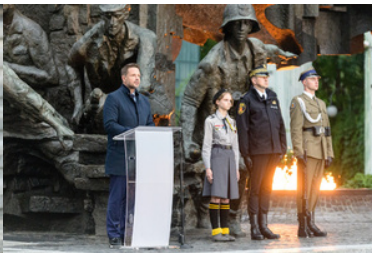
Przemawia Prezydent miasta stołecznego Warszawy.