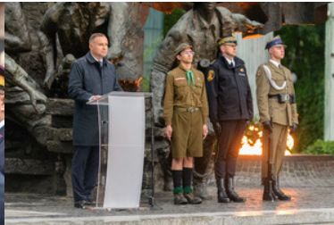
Przemawia Prezydent Andrzej Duda. Obok stoi posterunek honorowy.