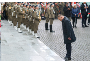
Prezydent oddaje hołd przed Pomnikiem Powstania Warszawskiego.