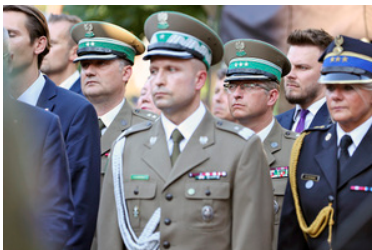
Stoi delegacja Straży Granicznej podczas uroczystości pod Pomnikiem ofiar Rzezi Woli.