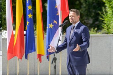
Przemawia Pan Rafał Trzaskowski