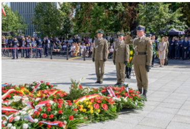
Żołnierz Pułku Reprezentacyjnego oddaje honor. Na drugim planie delegacja NwOSG.