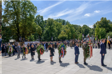
Przed Pomnikiem stoją delegacje z wieńcami.