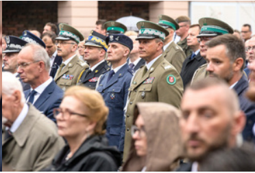
Stoją Komendanci służb mundurowych.