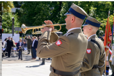
Trębacz i werblista.