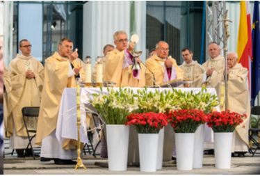
Biskup Polowy i księża trzymają Ciało Boże.