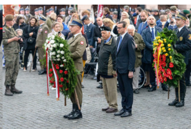
Wieniec składa Premier Mateusz Morawiecki.