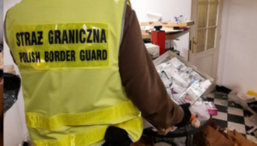
Funkcjonariusz SG trzyma karton z saszetkami.