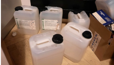
Kanistry z chemikaliami.