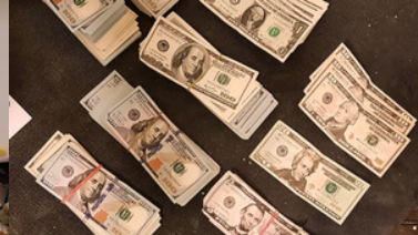
Na podłodze leżą dolary o różnych nominałach.