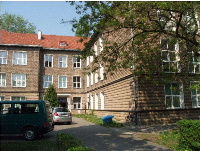
Elewacja frontowa – skrzydło prawe (prostopadłe)

Budynek murowany, tradycyjny, z układem ścian konstrukcyjnych podłużnych oraz podciągach opartych na żelbetowych słupach. Ściany piwnic wykonane z cegły pełnej ceramicznej, ściany powyżej z cegły pełnej ceramicznej licowanej barwioną cegłą wapienno-piaskową. Grubość ścian zewnętrznych około 65 cm, wewnętrznych nośnych około 43-44 cm. Stropy gęstożebrowe DMS, Ackermana oraz częściowo żelbetowe. Dach kopertowy, drewniany o konstrukcji płatiowo-kleszczowej, kryty dachówką ceramiczną - karpiówką. Obróbki blacharskie z blachy stalowej ocynkowanej.