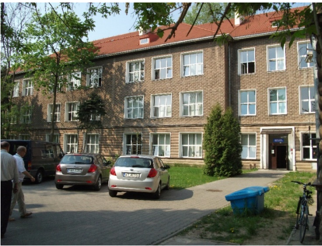
Elewacja frontowa – wejście główne do budynku nr 5